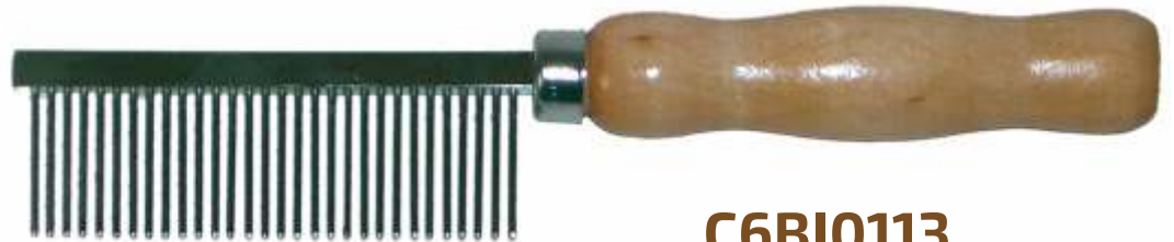
GRZEBIEŃ 3,6/18,5cm 23mm