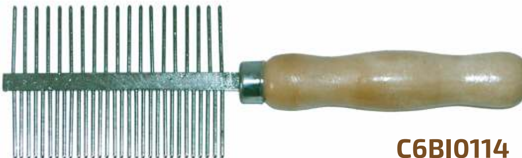
GRZEBIEŃ DWUSTRONNY 23mm