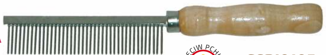
GRZEBIEŃ DO WYCZESYWANIA PCHŁ 23mm

DLA FALOWANEJ, DŁUGIEJ, SZCZECINIASTEJ I KRÓTKIEJ SIERŚCI