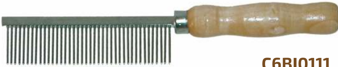
GRZEBIEŃ 3,6/19,8cm 23mm