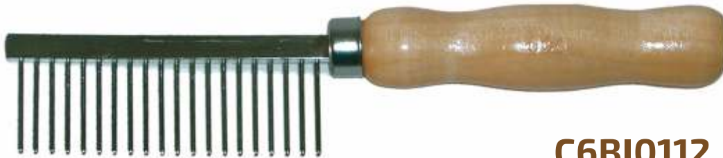
GRZEBIEŃ 3,5/17cm 23mm

DLA FALOWANEJ, SZCZECINIASTEJ, KRÓTKIEJ SIERŚCI