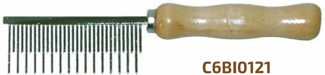
GRZEBIEŃ DWUSTOPNIOWY 16mm / 23mm

DLA FALOWANEJ, DŁUGIEJ, SZCZECINIASTEJ SIERŚCI